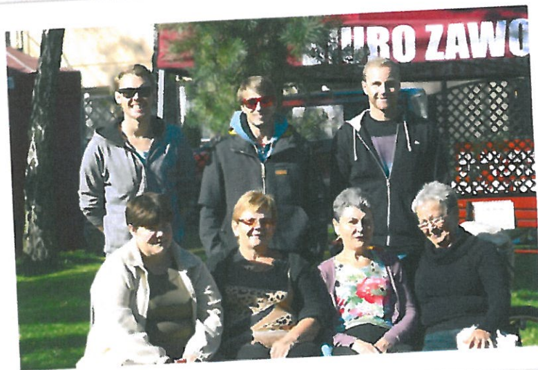
Na zdjęciu MISTRZ Świata w pływaniu Przemysław Stańczyk Mateusz Sawrymowicz i Mistrz Świata w windsurfingu Robert Bałdyga